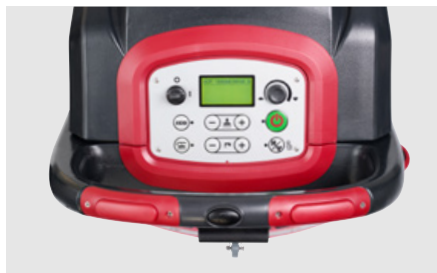
所有型号均配有直观的 LCD 控制面板 (图示为 AS6690T/AS7690T)