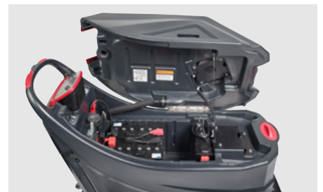
带手柄的废水箱，便于倾斜